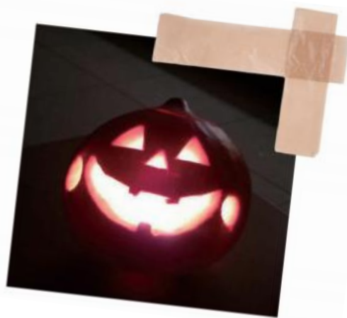
在黑暗笼罩下复活的南瓜怪

谈及感受，在同学们的心中，温馨和欢乐成为人大万圣节的关键词。师兄师姐不仅给同学们送糖送南瓜，为大家化上稀奇古怪的妆，更是在大合唱繁重的排练之余举办各种万圣节小游戏，让每一个统院人紧紧地凝聚成一个有爱而温馨的大家庭，为远离家乡的同学们找到浓浓的归属感，传递欢乐。