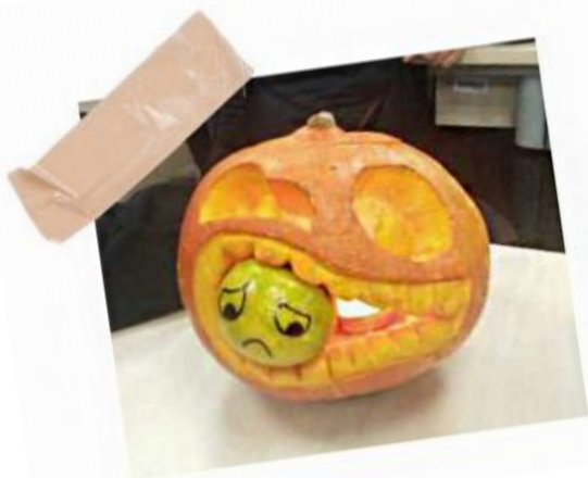
同学们的创意南瓜设计

脑洞大开的刻南瓜竞赛，“牺牲”自我的学长奇装异服展示，还是挨家挨户的“trick or treat”？哪项活动给你留下了最深的印象？经过多位同学的采访与调查，我们发现大家对刻南瓜活动情有独钟。提起画笔，勾勒轮廓，谈笑间一个个活灵活现的南瓜怪随着光影舞动。或许是自己动手的快感，亦或是团结一心完成作品的感觉，让大家深深地融入万圣节的氛围。一个个可爱的南瓜灯，有的咧开嘴笑，有的作出恶狠狠的模样，但都散发着沁人的香味，用美丽的灯光照亮了脸，也温暖着心。