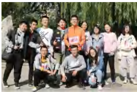
中国人民大学第七届体育文化节暨 2018 级新生田径运动会