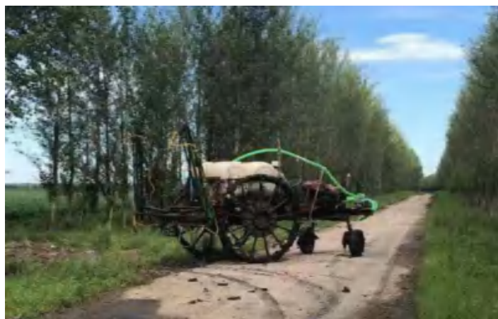
（调研过程中看到的“巨轮”）

e) 准备调研过程中的生活用品，推荐带一些零食，如巧克力、小面包等，以补充体力。