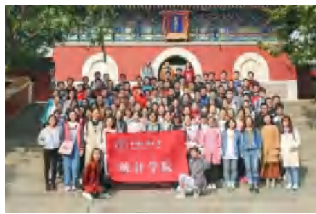
统计学院 2018 级本科新生秋游活动