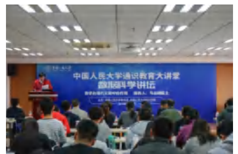
中国人民大学通识教育大讲堂—— 数据科学讲坛