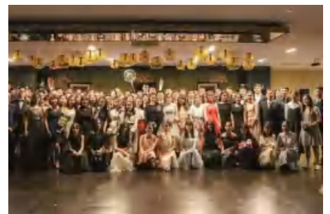
统计学院 2018 级新生舞会