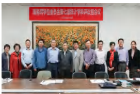
国务院学位委员会第七届统计学科 评议组会议