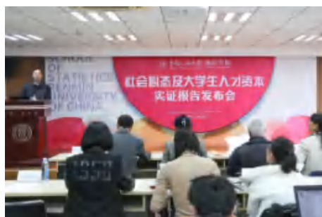
社会心态及大学生人才资本实证报 告发布会